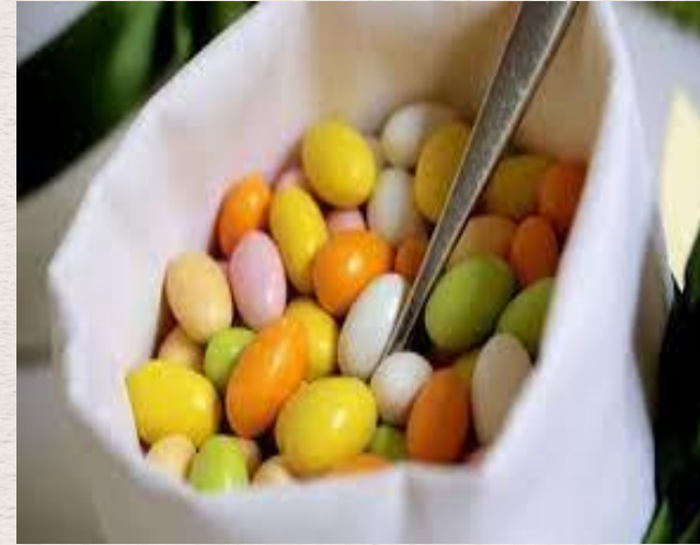
Les dragées de Sulmona