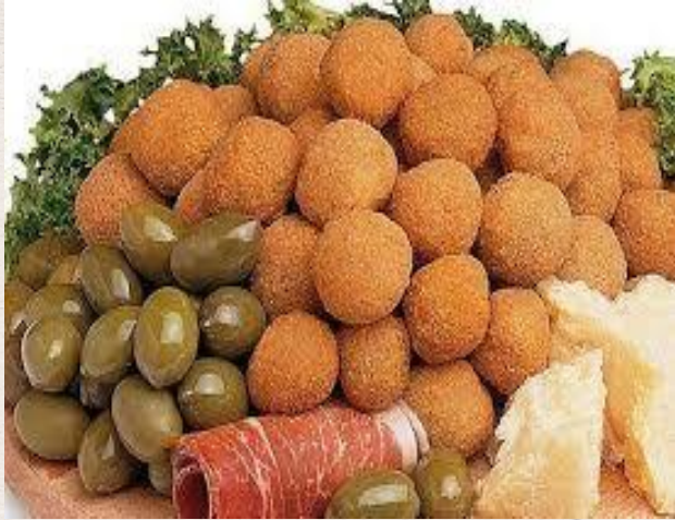
Les olives à l'ascolana