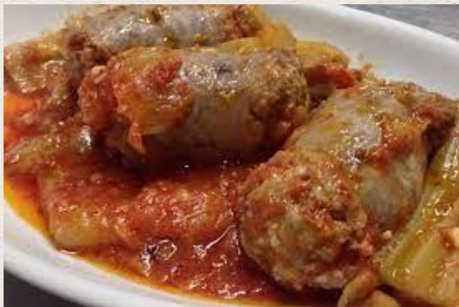
Chardons à la saucisse