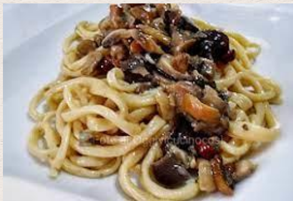
Pici aux cèpes