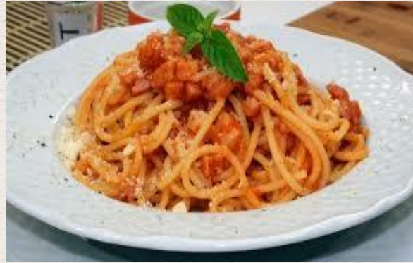
Les spaghettis à l'amatriciana