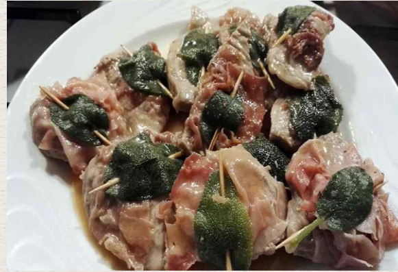
Les saltimboccas à la romana