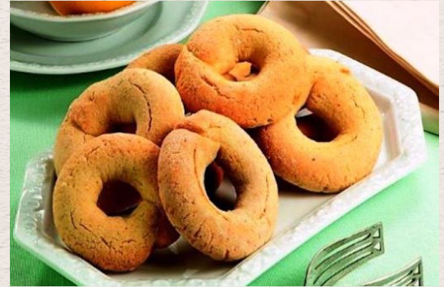
Les beignes du Latium