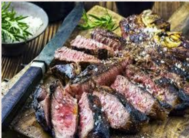
Le bifteck à la florentine