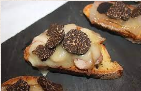
Croutons aux truffes et au fromage