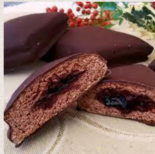
Mostaccioli du Molise