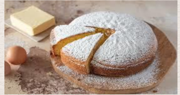
Gateau du paradis