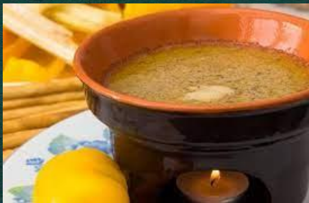
La bagna cauda