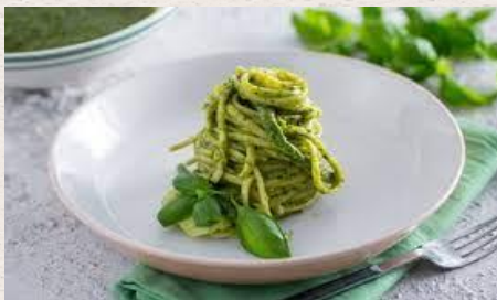
Les trenettes au pistou