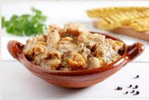
La morue à la vicentina